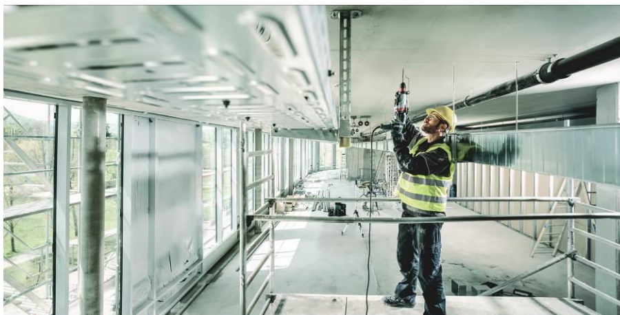
Marteaux perforateurs SDS-plus de 2 kg

KHE 2660 Quick KHE 2860 Quick UHE 2660-2 Quick UHEV 2860-2 Quick