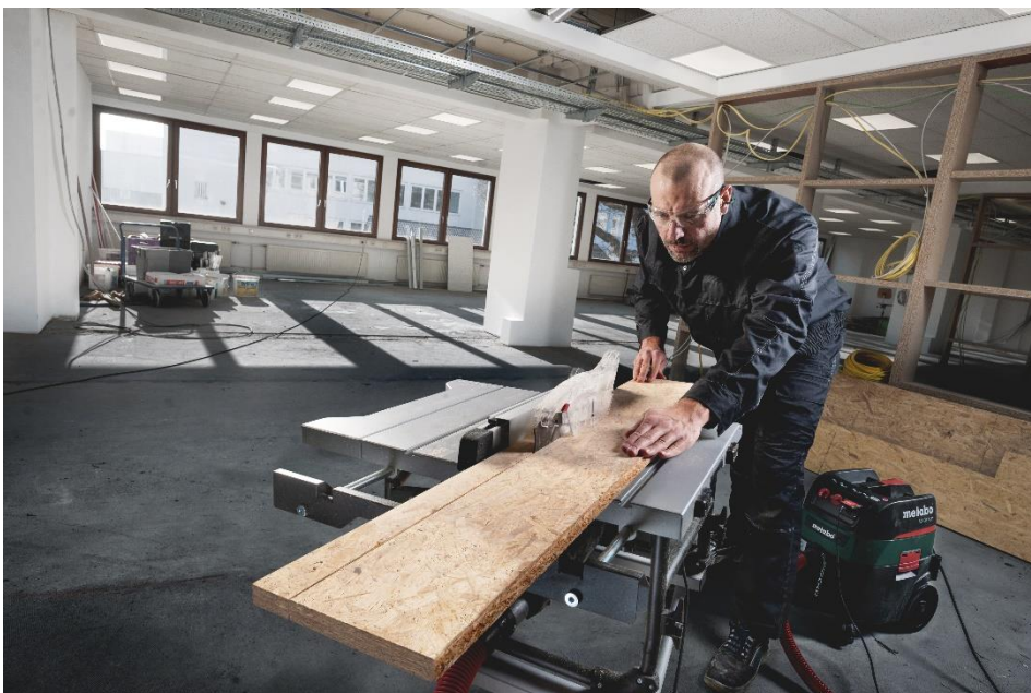
La scie TS 254 M permet aux utilisateurs de réaliser des coupes parallèles précises, y compris sur des grandes pièces.