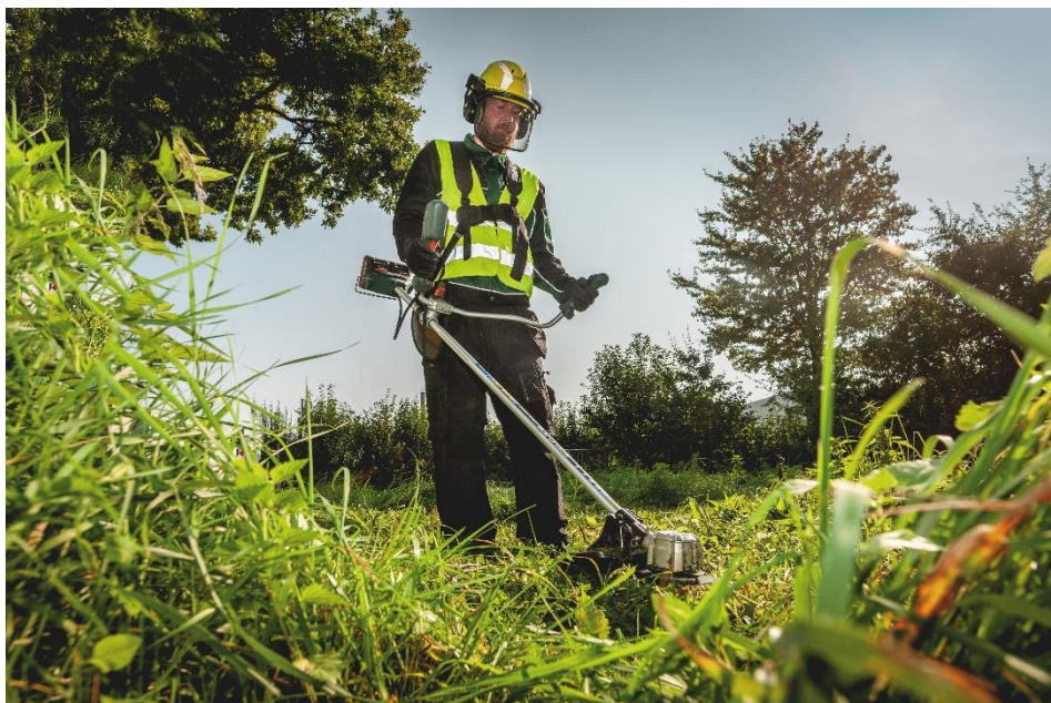
La nouvelle débroussailleuse FSB 36-18 LTX BL 40 assure des coupes efficaces y compris pour les applications exigeantes.